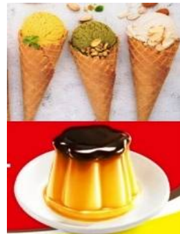
圖 10C 製

參考資料：周繡玲、謝嘉芬、李佳諭、江孟冠、紀雯真(2013)·癌症病人口腔黏膜炎臨床照護指引(第二版)·腫瘤護理雜誌，13，61-89。