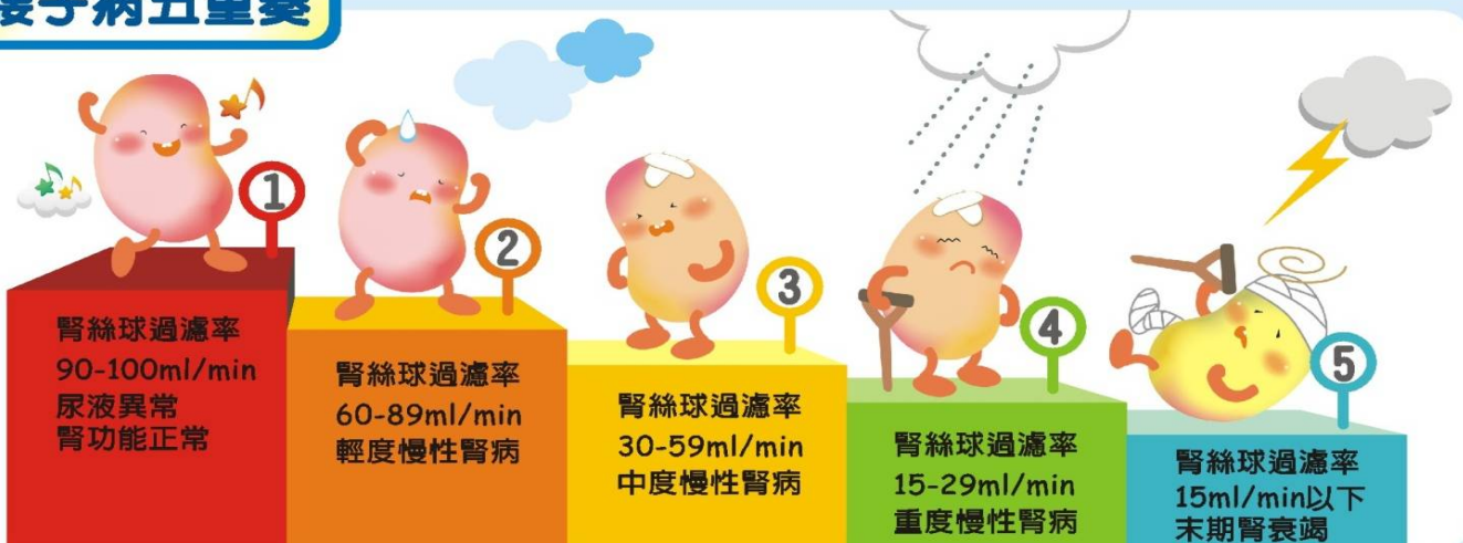
阮綜合 CKD 製圖