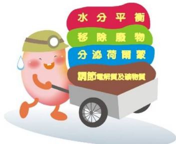
阮綜合 CKD 製圖