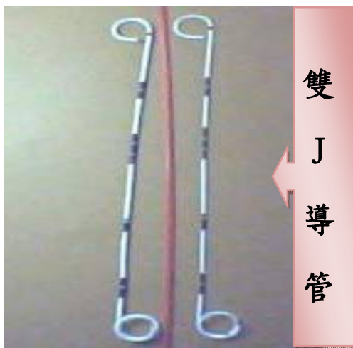
圖泌尿科治療室製

主要是利用導管的特殊設計，其形狀類似一長條的「S」型，利用管子兩端圓形勾起的形狀，一端勾住腎臟和輸尿管、另一端勾住輸尿管與膀胱，以維持導管固定的穩定性。