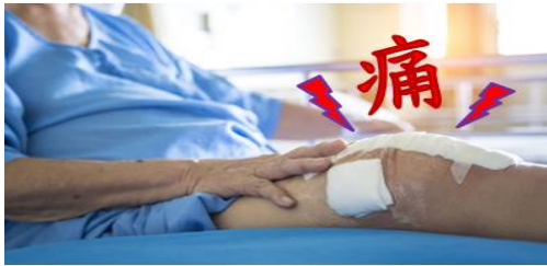
取自 7B 護理站