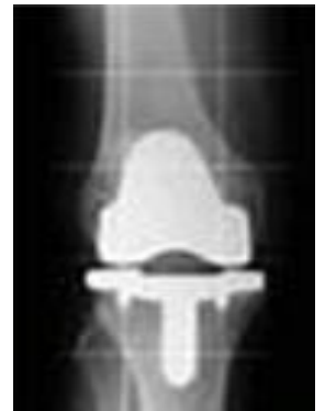
取自 7B 護理站

☞ 清晨06:00前，可喝無渣飲料，如運動飲料，勿超400cc. 後就連水應禁食。