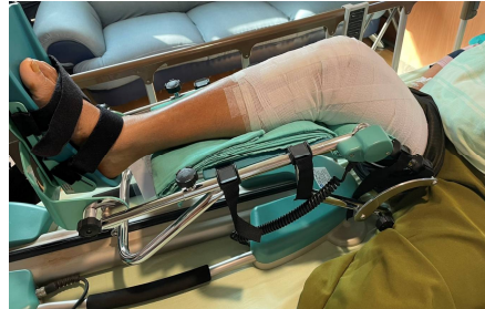
取自 7B 護理站