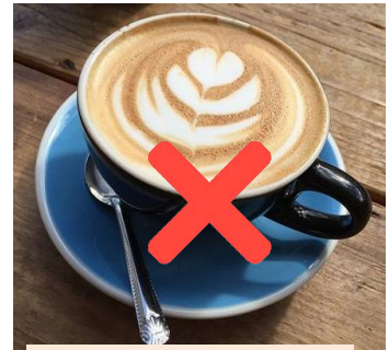
勿服用含有咖啡因 的食物 7A 製圖