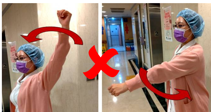
避免 360 度旋轉