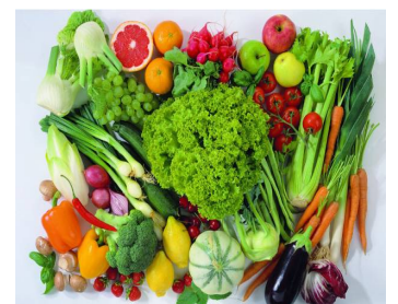
食用高纖維質蔬果