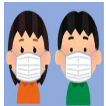
外出時請戴口罩